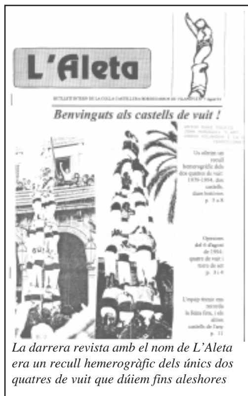
La darrera revista amb el nom de L'Aleta era un recull hemerogràfic dels únics dos quatres de vuit que dúiem fins aleshores