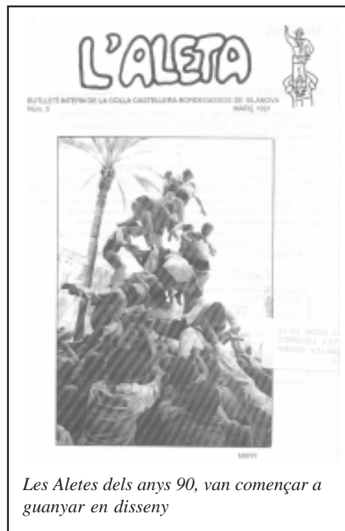
Les Aletes dels anys 90, van començar a guanyar en disseny