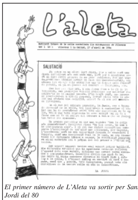
El primer número de L'Aleta va sortir per Sant Jordi del 80

Podríem renumerar-la de nou, podríem. Però llavors només serien 10 Aletes. Estareu d'acord que, una revista que fa 19 temporades que surt, mereix un número més elevat.