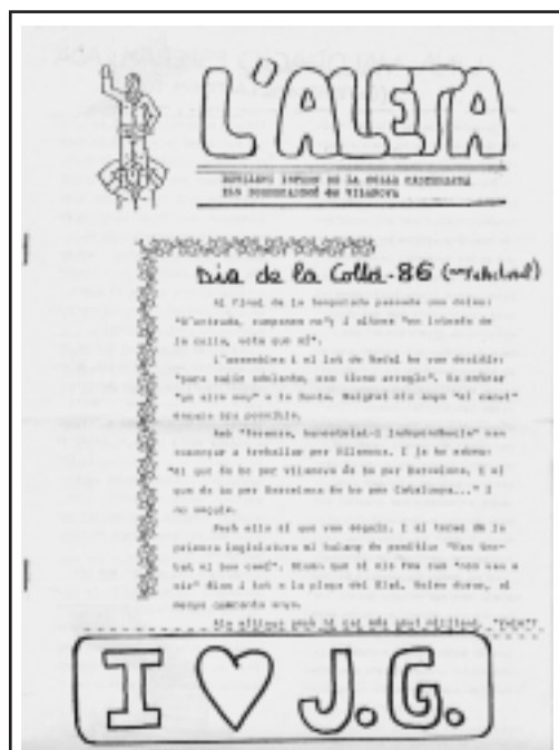
I love J.G., va una mofa bordegassa contra l'extinta Colla Jove de Vilanova